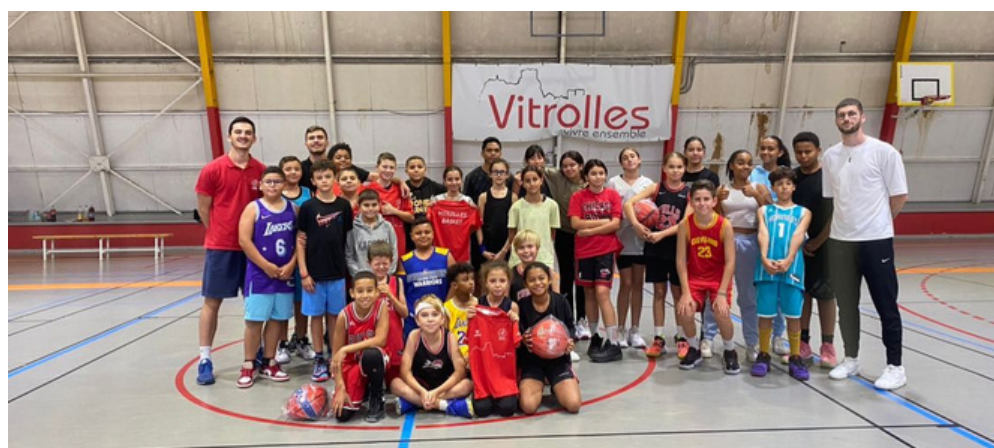
Le stage de la Toussaint a affiché complet pour les deux semaines